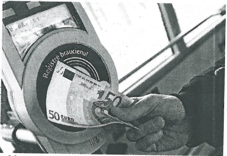
KRĪZĪTE AR PĒCMAKSU. Kamēr Maskavā krīze, mums te Rīgā tikai maza krīzīte vismaz galvaspilsētas budžetā

● Pagājuši 70 gadi, kopš likvidēta necilvēcības citadele Aušvicā. Bet tā joprojām ir dzīva liecība, ko cilvēks spēj nodarīt otram cilvēkam.