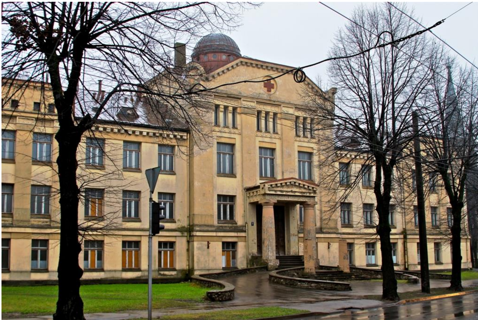
Latvijas Sarkanā Krusta slimnīca 1943./44.g.