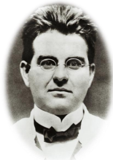
Hans Kristian Hagedorn (1888.-1971.)

Zinātniskais komandējums uz Dāniju – Niels-Steengena diabēta klīniku, pie prof.Hāgedorna