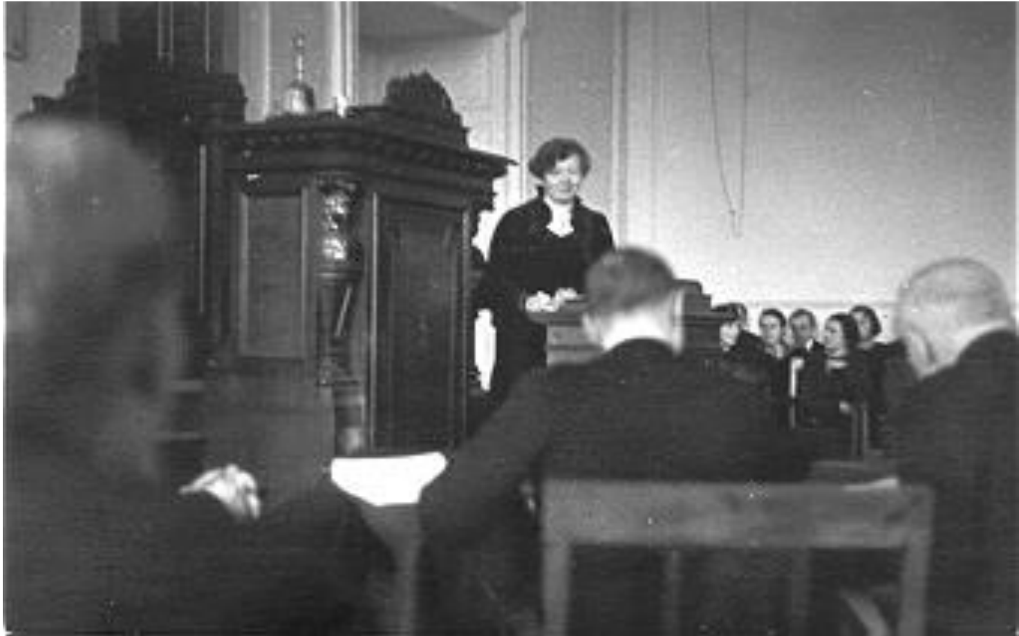
LU Mazā aula

“Eksperimentāli un klīniski pētījumi par dažiem miega un nomierināšanas līdzekļiem un to nozīme diabēta terapijā”