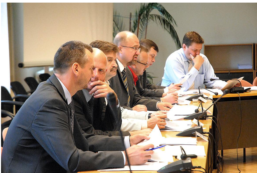
Komisijas sēde, strādājot ar likumprojektu „Maksātspējas likums”.

Līdztekus tautsaimniecības un uzņēmējdarbības jautājumiem komisija strādā ar lauksaimniecību, vidi un ar reģionālo politiku saistītiem likumprojektiem. Pieaugoša nozīme ir enerģētikas sektoram, un joprojām aktuāla ir privatizācijas un zemes reformas pabeigšana. Nozīmīga komisijas darba sastāvdaļa ir Ekonomikas ministrijas, Satiksmes ministrijas, Zemkopības ministrijas, Vides ministrijas, daļēji arī Reģionālās attīstības un pašvaldību lietu ministrijas un šajās nozarēs strādājošo valsts iestāžu darba pārraudzība. Lai pieņemtu kvalitatīvus lēmumus, komisija ņem vērā arī nozares lietpratēju un nevalstiskā sektora viedokli. Tādēļ komisijas sēdēs deputāti kopā ar ekspertiem aktīvi diskutē par Latvijas tautsaimniecības attīstības tendencēm un nākotnes perspektīvām. Padziļinot komisijas darbu enerģētikas politikas veidošanā un atjaunojamo energoresursu izmantošanas veicināšanā, izveidota Enerģētikas apakškomisija.