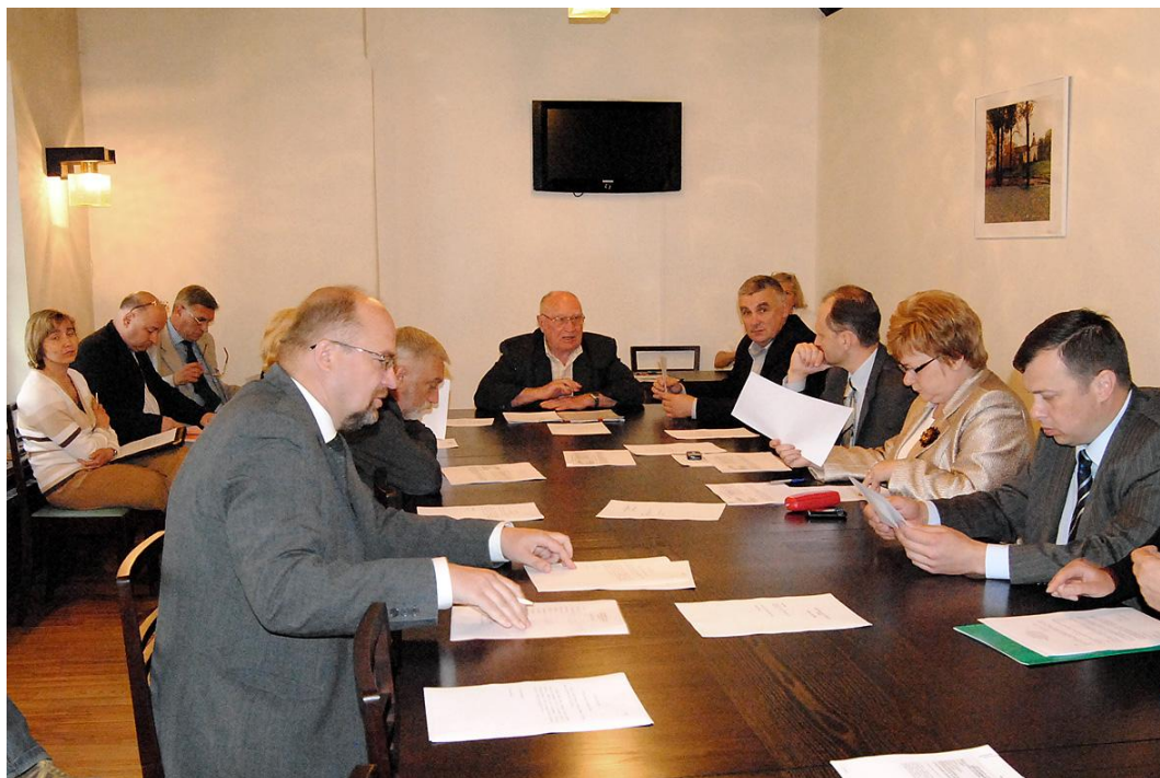
Saimnieciskās komisijas 16.jūnija sēdē.

Parlamenta Saimnieciskās komisijas ziņā ir Saeimas saimniecības uzraudzība un kontrole. Katru gadu sadarbībā ar Saeimas Kanceleju komisija sagatavo ikgadējo Saeimas budžeta pieprasījumu. Komisija arī koordinē Saeimas frakciju, komisiju un deputātu darba nodrošinājumu, uzrauga valsts iepirkumus, ēku remontus, kā arī Saeimas finanšu līdzekļu izlietojumu. Tāpat komisija lemj par kompensācijām deputātiem par dzīvojamo telpu īri vai viesnīcas izdevumiem, transporta un sakaru izdevumiem.