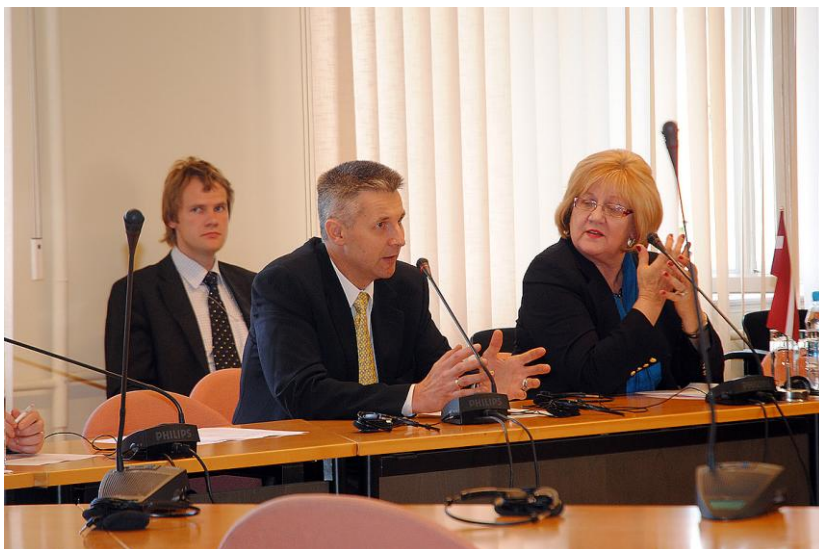
Eiropas lietu komisijas 24.maija sēdē.

Komisija ir viena no būtiskākajām Eiropas Savienības jautājumu koordinācijas instancēm Latvijā. Tas ir noslēdzošais posms, sagatavojot Latvijas nostājas jeb nacionālās pozīcijas par ES ministru padomēs izskatāmajiem jautājumiem. Pozīcijas Saeimā tiek iesniegtas pēc to apstiprināšanas Ministru kabinetā. Ministram, kurš pārstāv Latviju attiecīgās nozares ES ministru padomē, ir pienākums iepazīstināt komisiju ar Latvijas valdības nostāju visos nozīmīgajos lēmumos attiecībā uz likumdošanu un stratēģiskajiem jautājumiem. Ministrs saņem parlamenta mandātu paust Latvijas viedokli ES ministru padomes sanāsmē tikai pēc tam, kad pozīcija ir saskaņota ar komisiju. Komisija organizē regulāras tikšanās ar ministriem, ekspertiem un sociālajiem partneriem, lai apspriestu visdažādākos ES dienaskārtības jautājumus.