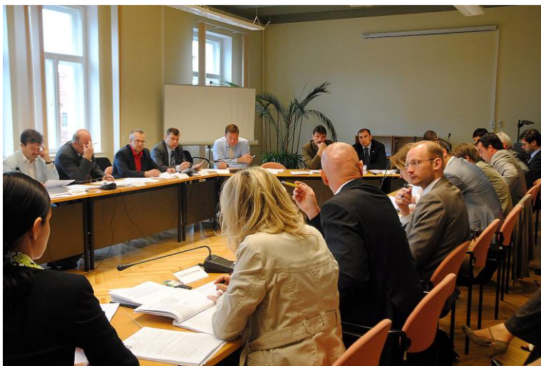
Komisijas sēdē, strādājot pie Maksātnespējas likumprojekta sagatavošanas trešajam lasījumam.

Lai nodrošinātu maksātnespējas procesa sākotnējo finansēšanu, kopā ar maksātnespējas procesa pieteikumu būs jāiemaksā depozīts divu minimālo mēnešalgu apmērā. Līdz ar to valstij vairs nebūs jāsedz izmaksas maksātnespējas procesos, kur parādniekam nav aktīvu, un maksātnespējas procesu neizmantos kā parādu piedziņas mehānismu. Šobrīd izveidojusies situācija, ka bieži vien maksātnespēja tiek pieteikta, ja uzņēmums aizkavējies samaksāt rēķinu vai tam izveidojusies neliels parāds.