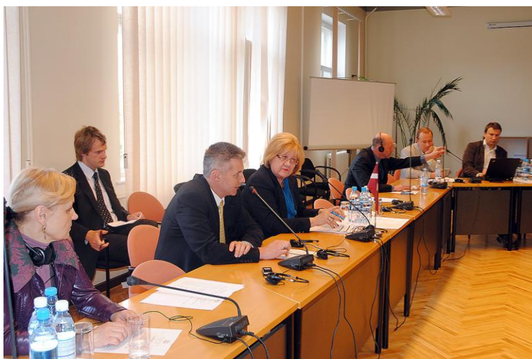
Komisijas tikšanās ar ASV Vestpointas militārās akadēmijas kadetiem.