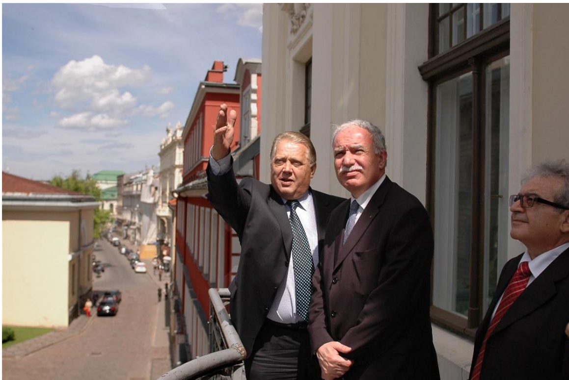
Komisijas priekšsēdētājas Andris Bērziņš, 18.jūnijā tiekoties ar ārvalstu viesiem.

Komisija izskata ar ārlietām saistītus tiesību aktus, kā arī veic parlamentāro kontroli pār ārlietu jomu. Pirms apspriešanas Saeimas sēdē komisija izskata un lemj par starpvalstu līgumiem, Latvijas pievienošanos starptautiskajām konvencijām, kā arī citiem ar ārlietām saistītiem jautājumiem. Komisijā tiek saskaņotas mūsu valsts ārpolitikas nostādnes un priekšlikumi starpvalstu attiecību attīstībai. Komisija izskata un apstiprina nominēto Latvijas vēstnieku kandidatūras, tās viedoklis ir rekomendējošs Valsts prezidentam, kurš ieceļ vēstniekus amatā. Tāpat komisija vērtē Latvijas vēstniecību darbu. Komisija arī veic aktīvu darbu starptautiskajā līmenī, skaidrojot valsts ārpolitikas nostādnes.