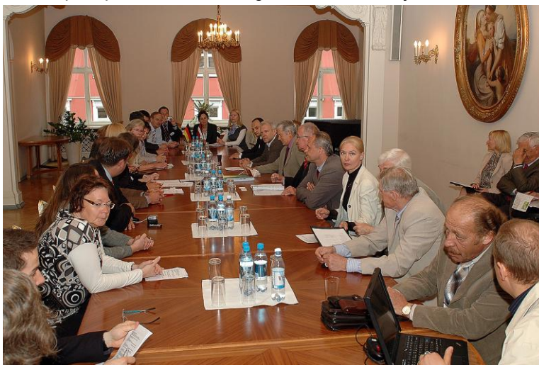
Komisijas tikšanās ar Lejassaksijas parlamenta delegāciju.

2010.gada maijā Latvijā darbojas 18 valsts un 8 privātās koledžas, kurās mācās 11 procenti no visiem studentiem. Statistikas dati liecina, ka, neskatoties uz studentu skaita samazinājumu augstākās izglītības iestādēs, koledžas līmeņa studiju programmās studējošo īpatsvaram ir tendence pieaugt.