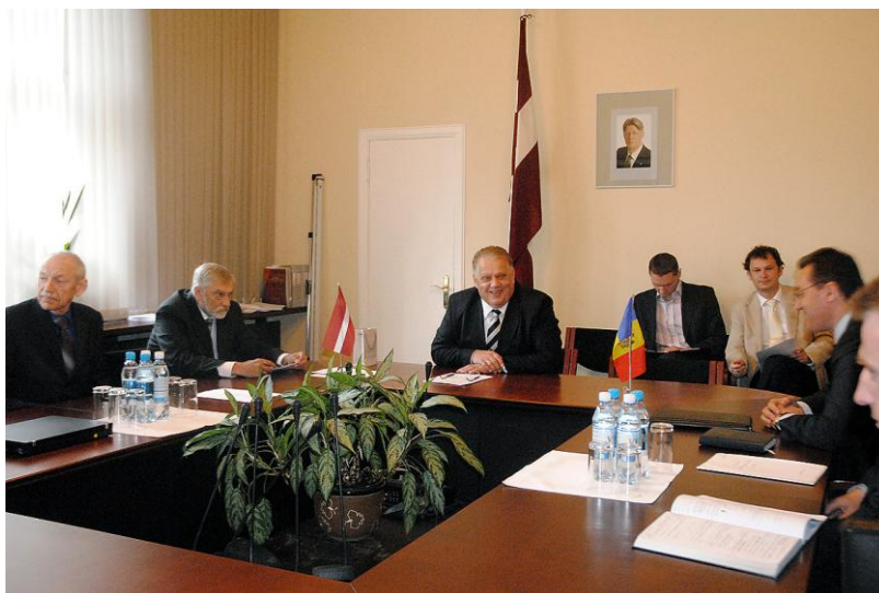
Komisijas tikšanās ar Moldovas parlamenta Ārlietu un Eiropas integrācijas komisijas delegāciju.

Uz septiņiem latviešu centriem ASV, pieciem Austrālijā un četriem Kanādā iecerēts nosūtīt vienu Ārlietu ministrijas Konsulārā departamenta un vienu Pilsonības un migrāciju lietu pārvaldes darbinieku. Šie darbinieki visus jaunajām pasēm nepieciešamos datus iegūs uz vietas, tādējādi atvieglojot pasu atjaunošanas procesu. Darbs pie šī jautājuma sākts pēc Ārlietu komisijas iniciatīvas, kad komisijas deputātiem ASV apmeklējuma laikā šī gada martā uz to bija norādījuši Amerikas Latviešu apvienības pārstāvji.