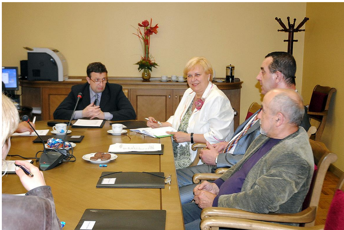
25.marta sēdē, izskatot komisijā saņemtos iesniegumus.

Komisijas galvenie uzdevumi noteikti Saeimas kārtības rullī. Komisija pārbauda vēlēšanu materiālus un sagatavo lēmuma projektus par deputātu mandātu apstiprināšanu vai to atsaukšanu. Pēc komisijas ziņojuma uzklaustīšanas Saeima lemj par deputātu saukšanu pie administratīvās atbildības vai kriminālatbildības. Komisijas uzdevums ir pārraudzīt Saeimas deputātu ētikas kodeksa ievērošanu un izskatīt kodeksa pārkāpumu lietas. Komisijas pienākumos ietilpst arī ikmēneša pārskata sagatavošana Saeimai par iesniegumiem, kas saņemti Saeimas Sabiedrisko attiecību birojā, kā arī par to izskatīšanu Saeimas frakcijās un komisijās.